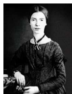
La biografia di Dickinson Emily