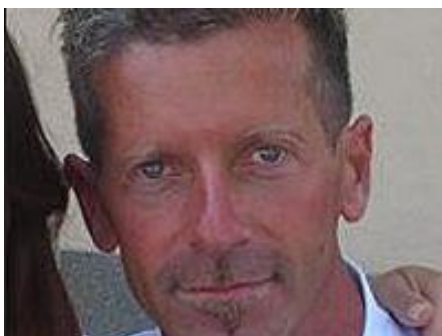
Yara, "L'assassino potrebbe essere un parente"