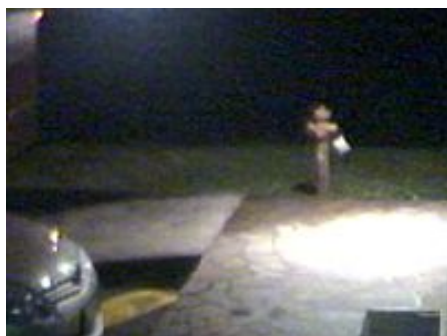
Yara, il video che inchioda Bossetti