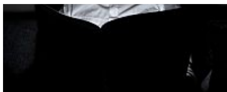
I libri più belli del 2013: i 10 migliori romanzi italiani