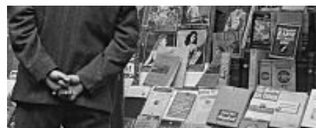
10 libri di successo in uscita a novembre