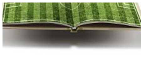
I libri più belli del 2014: sport