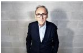
Battiato racconta l'aldilà alla Mondadori Duomo