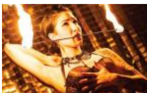
Capodanno 2015. Da Maison Milano scatta la Golden Fever