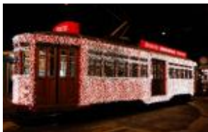
Natale 2014. Spontini firma il tram di luce