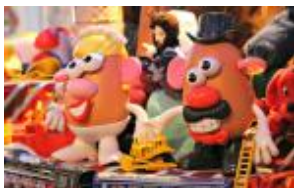
Natale solidale. Al Social Market la raccolta di giocattoli