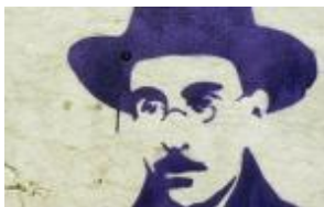
Alma portuguesa. Il circolo filologico ricorda Pessoa