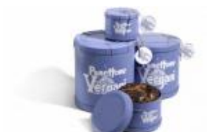
70 anni di panettone Vergani. Arriva la confezione speciale