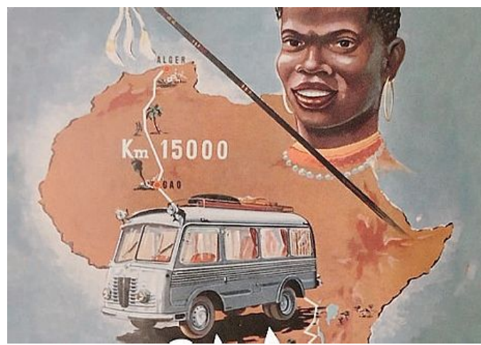
Particolare della copertina della riedizione di "Africa a cronometro"

Oggi non ci sono più esploratori, né terre da esplorare, e neppure grandi viaggiatori. Ormai il mondo si è fatto piccolo e chiunque può raggiungere agevolmente i quattro angoli del pianeta. Eppure fino a pochi anni fa non era così. Egisto Corradi, classe 1914, morto nel 1990, era un giornalista che raccontava il mondo a chi non lo conosceva con memorabili reportage. Giovane ufficiale degli alpini nella seconda guerra mondiale, Corradi maturò proprio in quegli anni la sua vocazione a diventare inviato di guerra. E così, tra Corea e Ungheria, Cuba e Vietnam, Israele e Cina, divenne più che un giornalista di guerra un narratore chiaro e sincero, lontano dalle infarciture ideologiche che spesso "contaminano" chi fa il suo mestiere. Per molti il più grande giornalista del dopoguerra italiano. E la stessa onestà narrativa la ritroviamo in questo suo diario africano, in cui illustra il primo e massacrante rally continentale del 1953, da Algeri a Città del Capo. È il racconto minuzioso di un'impresa che va al di là del valore puramente sportivo, con le sue storie legate alla sete, alle tempeste di sabbia, al sole co-