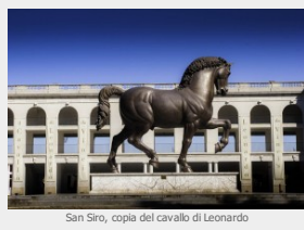
San Siro, copia del cavallo di Leonardo