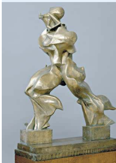
▲ Umberto Boccioni “Quest'opera rappresenta una figura modificata dalla velocità ma sembra un supereroe!”