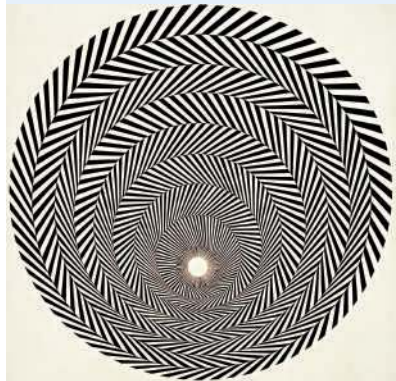
▲ Blaze di Bridget Riley “In quest'opera c'è un'illusione ottica che ti fa sentire gli occhi strani ed è molto intelligente”