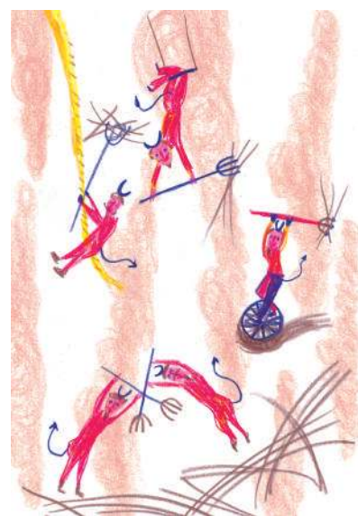
▲ Dalle parole all'immagine "Ho un diavolo per capello"...