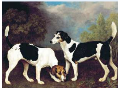
▲ I segugi di George Stubbs “Dinanzi al quadro i ragazzi possono pensare a come disegnare l'animale del cuore”