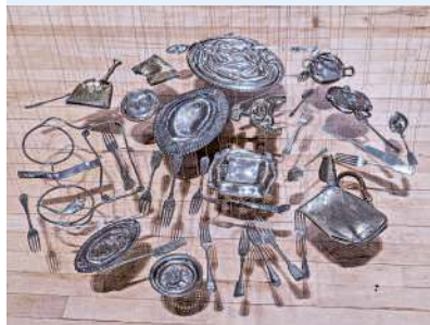
▲ I 30 pezzi di Cornelia Parker “Cucchiai, trofei, tromboni tutti schiacciati da un rullo: pensate agli oggetti in modo diverso!”