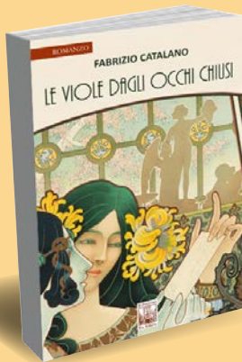
Fabrizio Catalano Le viole dagli occhi chiusi Ex Libris edizioni, pp. 162, € 15,00

Regista e autore (nipote di Leonardo Sciascia), Fabrizio Catalano, con questo romanzo, mette in scena una trama misteriosa dal sapore esotico. Protagoniste due sorelle gemelle, Fresia e Leda che, cresciute in un convento in Bolivia, vengono adottate e condotte a Bruxelles. Attorno a questi eventi cresce la narrazione, caratterizzata dalle voci delle due protagoniste. Il libro di Catalano cattura subito il lettore per immergerlo in una dimensione di bellezza, di citazioni letterarie e figurative grazie a una scrittura raffinata ed evocativa. Un romanzo che è una vera sorpresa, consigliata a chi vuole ritrovare lo spessore di un linguaggio più ricco e suggestivo rispetto alla prosa contemporanea.