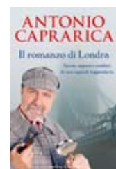
Il romanzo di Londra, di Antonio Caprarica, Sperling & Kupfer 2014, 318 pagine, 18,50 euro.

Lo stile è quello solito di Antonio Caprarica, pungente, arguto e vivace. L'argomento è la "sua" Londra, quella vissuta in tanti anni di residenza nella capitale, sia per lavoro in qualità di corrispondente per la Rai, sia per diletto. Per l'autore, se Parigi è "una scarpina a punta stretta e tacco dodici", Londra è "una vecchia pantofola per la comodità della vita che offre". Una città esuberante di storia, di storie, di misfatti, di leggende e di curiosità che difficilmente una guida racconta approfonditamente oltre al doveroso accenno e che invece il giornalista Caprarica illustra con la sua consueta fascinosa affabulazione.