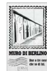
Muro di Berlino. Due o tre cose che so di lui, a cura di Eusebio Trabucchi, L'orma editore 2014, 104 pagine, 8 euro.

A 25 anni dalla caduta il libro racconta il Muro di Berlino con foto, disegni, numeri, musei, film e grazie a un suo alfabeto che, dalla A alla Z, ne narra curiosità, aneddoti e storia. Con un'idea sfiziosa dell'editore: il libro può essere spedito grazie a una sovracoperta a forma di busta. La si affranca e il regalo arriva per posta.