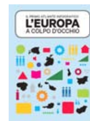
L'Europa a colpo d'occhio. Il primo atlante infografico, di Julia Sturm, 24 Ore Cultura 2014, 185 pagine, 19,50 euro.

58 sono le lettere del nome di un borgo gallese, il più lungo d'Europa. Il Paese con la maggiore superficie forestale, il maggior numero di laghi e di isole è la Finlandia. Questi alcuni dei tantissimi dati riportati nel libro, il primo atlante visuale interamente grafico, tutto dedicato all'Ue.