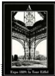
Expo 1889: la Tour Eiffel, Abscondita Album 2014, 166 pagine, 20 euro.

Mentre l'Italia si avvia verso l'Expo Milano 2015, Abscondita celebra il simbolo più famoso di un'altra esposizione di 125 anni fa: la Tour Eiffel. Costruzione effimera, destinata a essere demolita a conclusione dell'evento internazionale, rimase invece a dominare Parigi, fino a diventare icona insuperata. Dopo un'introduzione di Raymond Duchamp-Villon, scritta nel 1913, e una serie di foto d'epoca ( a sinistra , le verniciature del 1910 e del 1953) il libro ripubblica le tavole tratte dal libro del 1900 La Tour de trois cents mètres : travetti, archi, dettagli costruttivi, diagrammi e calcoli. La Tour svela tutti i suoi segreti e sembra un giocattolo d'antan, un vecchio Meccano, da montare e smontare a piacimento.