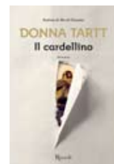
Il cardellino, di Donna Tartt, Rizzoli 2014, 893 pagine, 20 euro.

Ambientata a New York, a Las Vegas e Amsterdam, la storia del protagonista Theo Decker ha un fil rouge europeo nel quadretto dell'olandese Carel Fabritius, Il cardellino (1564), uno dei gioielli del museo Mauritshuis dell'Aia (vedere Bell'Europa , agosto 2014). Nel romanzo (Premio Pulitzer 2014) il quadro è in mostra al Metropolitan di New York, dove sono in visita Theo e la madre. Un attentato stile 11 settembre uccide la mamma e "consegna" a Theo il piccolo olio che rimarrà con lui fino all'età adulta, aiutandolo a capire chi è, a dare senso alla vita e a tutte le sue catene. Come la catenella che lega il cardellino al trespolo. Magistrale la descrizione del quadro che Donna Tartt offre nelle ultime pagine e dei rapporti tra opera d'arte, autore e spettatore.