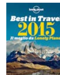
Best in Travel 2015. Il meglio da Lonely Planet, Edt Lonely Planet 2014, 208 pagine, 14,50 euro.

A 10 anni dalla prima pubblicazione, esce adesso anche in italiano la guida Lonely Planet con le migliori mete di viaggio nel mondo e i relativi consigli per 10 Paesi, 10 regioni e 10 città. In Europa si segnalano Irlanda, Serbia, Norvegia settentrionale, Zermatt e Vienna.