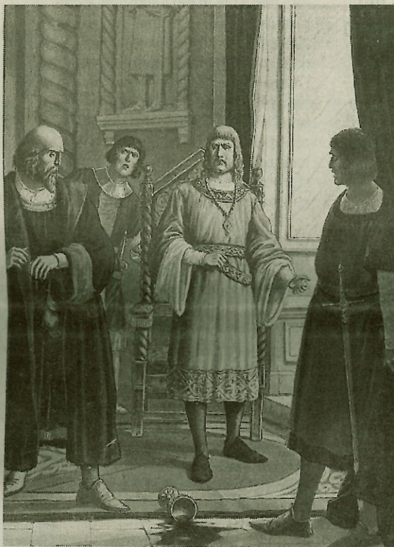
Pier de la Vigna in una illustrazione di Scarpelli, anni '30

Sul finire del canto (che è il XIII dell' Inferno ) Pier de la Vigna espone il destino che aspetta le anime dei Suicidi quando avranno recuperato il proprio corpo nel giorno del Giudizio: «Come l'altre verrem per nostre spoglie, / ma non però ch'alcuna sen rivesta, / ché non è giusta aver ciò ch'om si toglie. // Qui le strascineremo, e per la mesta / selva saranno i nostri corpi appesi / ciascuno al prun de l'ombra sua molesta». Ecco: per i Suicidi, come per tutti i peccatori la cui colpa include l'immaginazione della vita ulteriore (è il caso - a ricordarsene - di Farinata e degli atei Epicurei), il perfezionamento del contrappeso dopo il giudizio finale umilia quell'immagine, ribaltandola. Nell'uccidersi, nel perpetrare l'omicidio esoso che premedita anche l'altro versante della morte, essi si sono figurati di fuggir dispregio, lasciando al com-