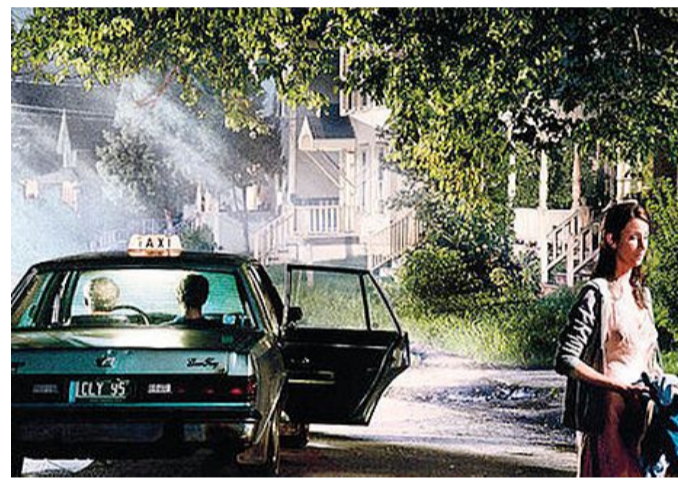
L'immagine di copertina de "La verità sul caso Harry Quebert"