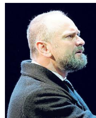
L'attore Massimo Popolizio

Insomma, l'America dello Svedese, appunto il protagonista